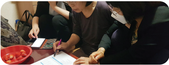
다문화가족 방문교육사업 온라인개학 학습지원 및 사전검사 실시