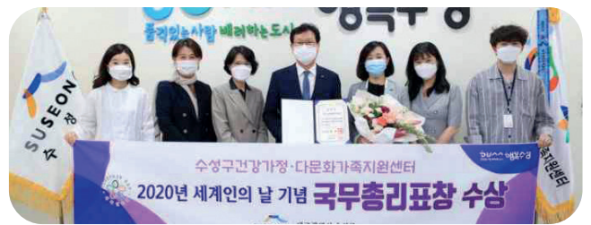
2020세계인의 날 기념 국무총리표창 수상