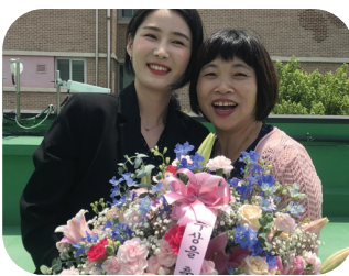
2020 여성가족부 장관상 수상