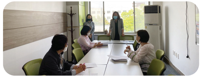
2020신규 아이돌보미 채용 오리엔테이션